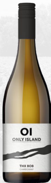
THX BOB (サンクス・ゴブ) シャルドネ